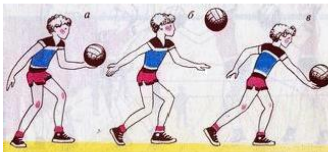
Рисунок 1 – Нижняя прямая передача

Нижняя прямая подача (см. рис. 1) выполняется из положения, при котором игрок стоит лицом к сетке, ноги в коленных суставах согнуты, левая выставлена вперед, масса тела переносится на правую стоящую сзади ногу. Пальцы левой, согнутой в локтевом суставе руки поддерживают мяч снизу. Правая рука отводится назад для замаха, мяч подбрасывается вверх-вперед на расстояние вытянутой руки. Удар выполняется встречным движением правой руки снизу-вперед примерно на уровне пояса. Игрок одновременно разгибает правую ногу и переносит массу тела на левую. После удара выполняется сопровождающее движение руки в направлении подачи, ноги и туловище выпрямляются.